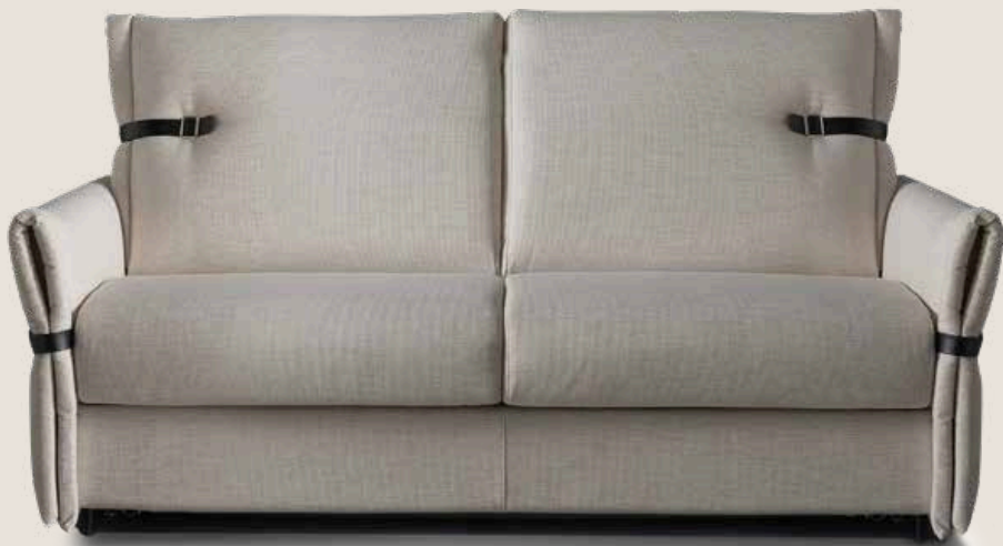
Tessuto Rasqar 14 Tissu Rasqar 14 Fabric Rasqar 14

The material used for this artisan product is always the center of attention for who makes it. The craftsman must love what he has in his hands, he must understand it and transform it with the maximum respect: combine colors and change their functions. In this way, new products always are born. The Louvre model emphasizes its soft shapes with swollen edges and tightened belts to better increase its originally contemporary character.